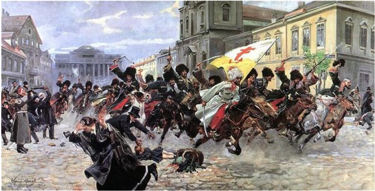
Wojciech Kossak, Czerkiesi na Krakowskim Przedmieściu. 1912. Olej na płótnie. 100 x 200 cm