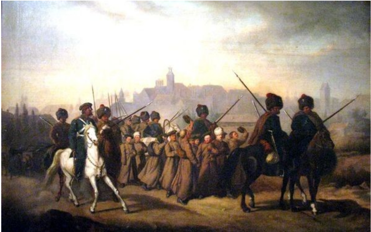
Aleksander Sochaczewski, Branka Polaków do armii rosyjskiej w 1863