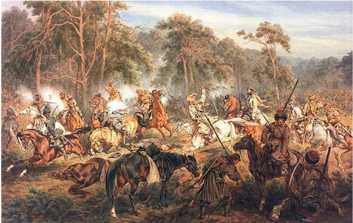
Juliusz Kossak, Bitwa pod Ignacewem. 1865. Akwarela, papier. 70 x 98 cm