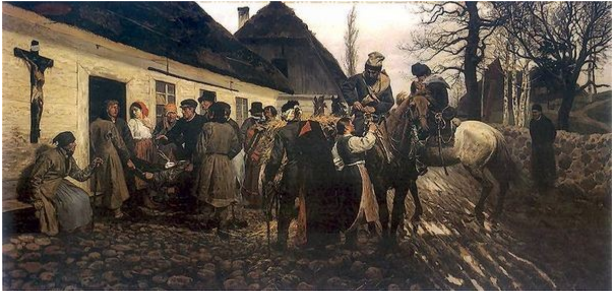
Stanisław Witkiewicz, Ranny powstaniec 1881. Olej na płótnie. 59,5 x 117 cm