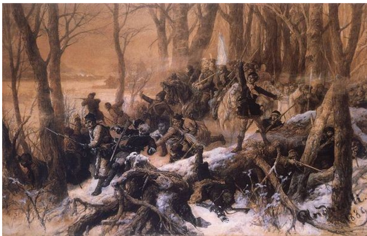
Michał Elwiro Andriolli, Walka powstańcza.

Paryża. Do kraju wrócił jako emisariusz Komitetu Emigracji Polskiej, w 1866 został aresztowany i zesłany do wiatki w środkowej Rosji. Ułaskawiony w 1871r., przyjechał do Warszawy, gdzie pracował jako ilustrator czasopism (m.in. Tygodnika Ilustrowanego) oraz utworów literackich (Mickiewicza, Słowackiego, Krasińskiego, Orzeszkowej). Szczególnie znane są jego ilustracje do Pana Tadeusza oraz Konrada Wallenroda Adama Mickiewicza, wykonane w latach 1879–1882. Malował również obrazy, m.in. dla kościołów w Kownie. Do 1880 roku kilkakrotnie przyjeżdżał do Nałęczowa, gdzie rysował jego pejzaże.