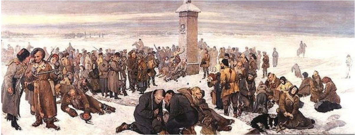
Aleksander Sochaczewski, Pożegnanie z Europą, 1894.

Obraz ma znaczenie symboliczne, autor uwiecznił szereg znanych zesłańców, zesłanych w różnych zsyłkach, w tym siebie - postać stojącą przy słupie granicznym z prawej strony - mężczyzna patrzący na słupek.