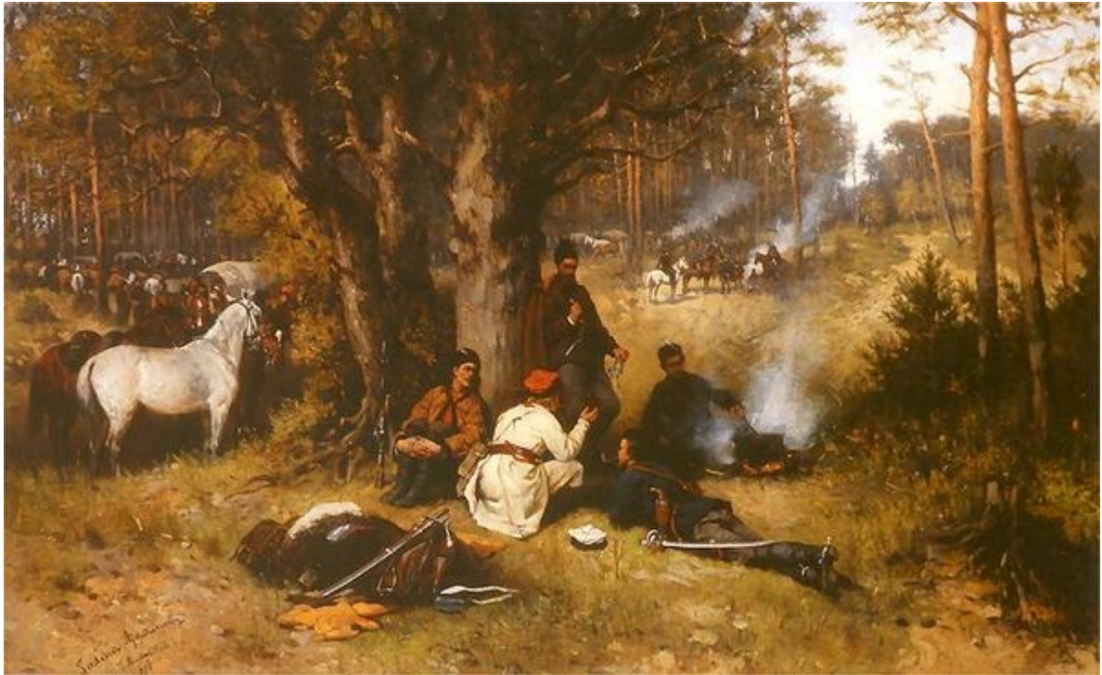
Tadeusz Ajdukiewicz, Obóz powstańców w lesie 1875. Olej na płótnie. 41 x 66 cm