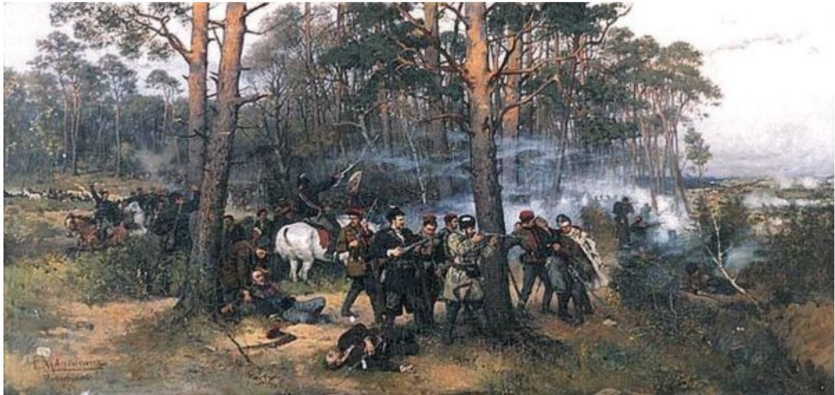
Tadeusz Ajdukiewicz, Scena z powstania styczniowego, 1875

Malarz, autor portretów, scen batalistycznych i rodzajowych. W latach 1868–1873 kształcił się w Szkole Sztuk Pięknych w Krakowie, a następnie w Akademiach Sztuk Pięknych: wiedeńskiej i monachijskiej (u O. Seitza i A. Wagnera) oraz w pracowni J. Brandta. Z licznych podróży przywiózł umiłowanie do tematyki orientalnej. Pracował jako malarz dworski, wykonując portrety na zamówienie. Autor bardzo wielu obrazów, w tym: Portret Władysława Eljasza, Portret Heleny Modrzejewskiej, Konstanty Branicki na polowaniu, Konie na pastwisku, Portret Andrzeja Potockiego na koniu. Malował również tematykę tatrzańską. W 1914r., u schyłku życia wstąpił do Legionów Polskich Józefa Piłsudskiego.