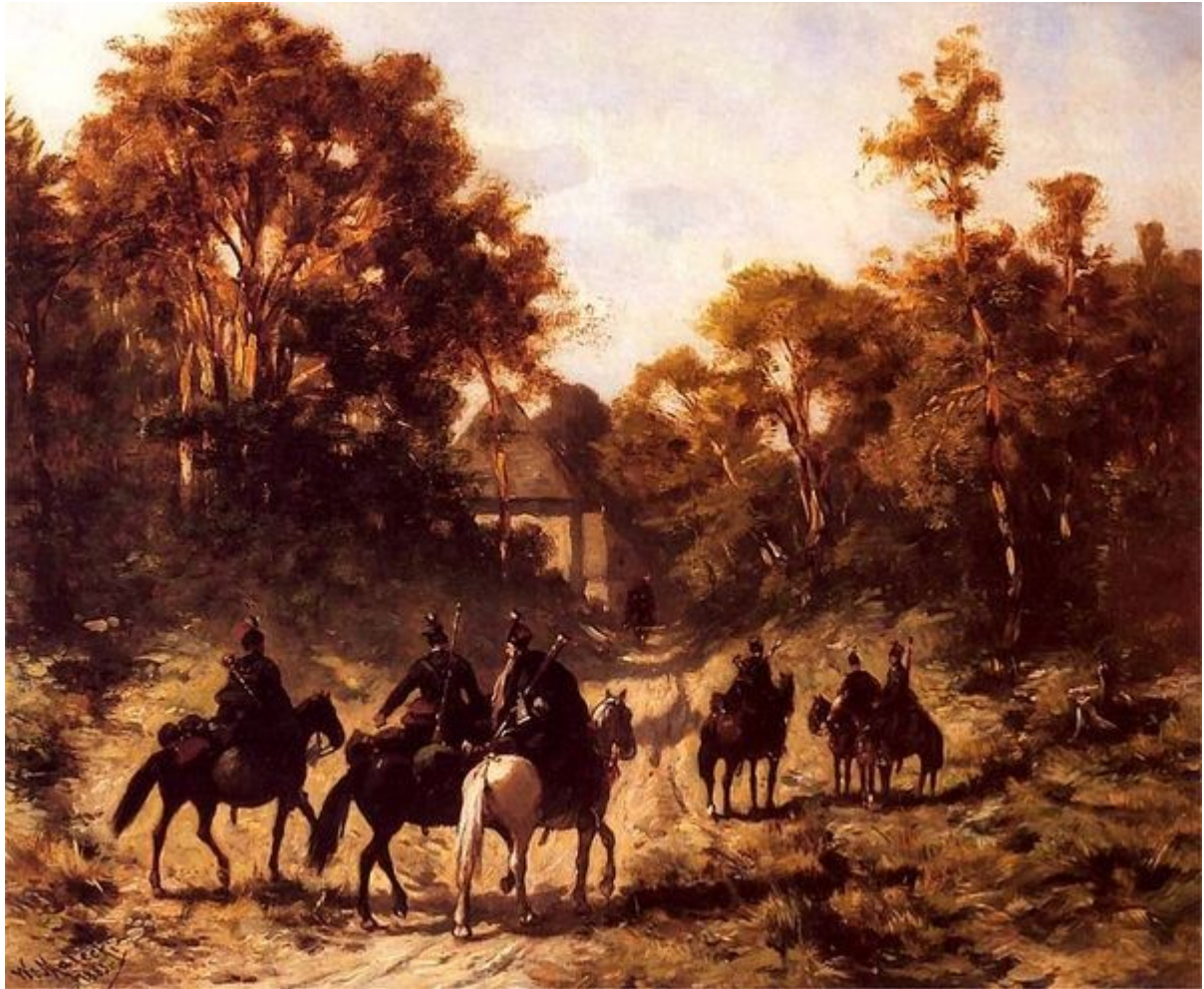
Władysław Malecki, Patrol powstańczy 1883. Olej na płótnie. 27 x 32 cm