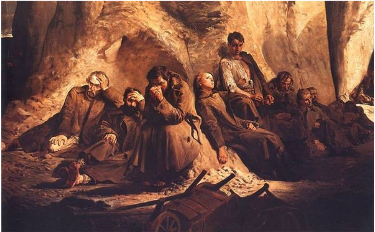
Jacek Malczewski, Niedziela w kopalni. 1882. Olej na płótnie. 118 x 180 cm