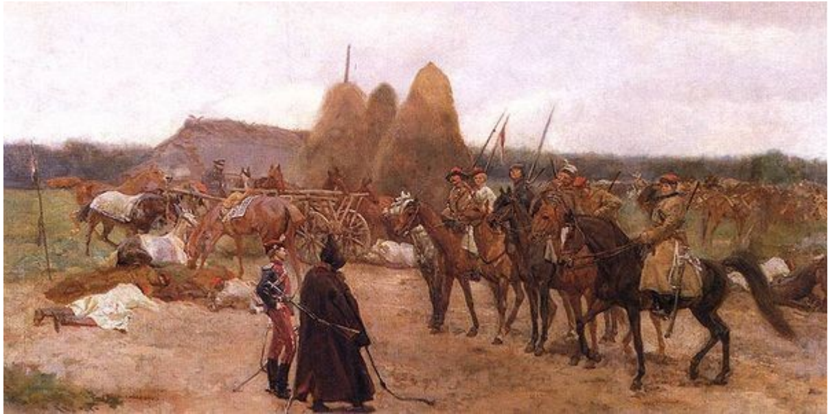
Józef Chelmoński, Epizod z powstania 1863 roku. 1884-1885. Olej na płótnie. 45 x 81 cm