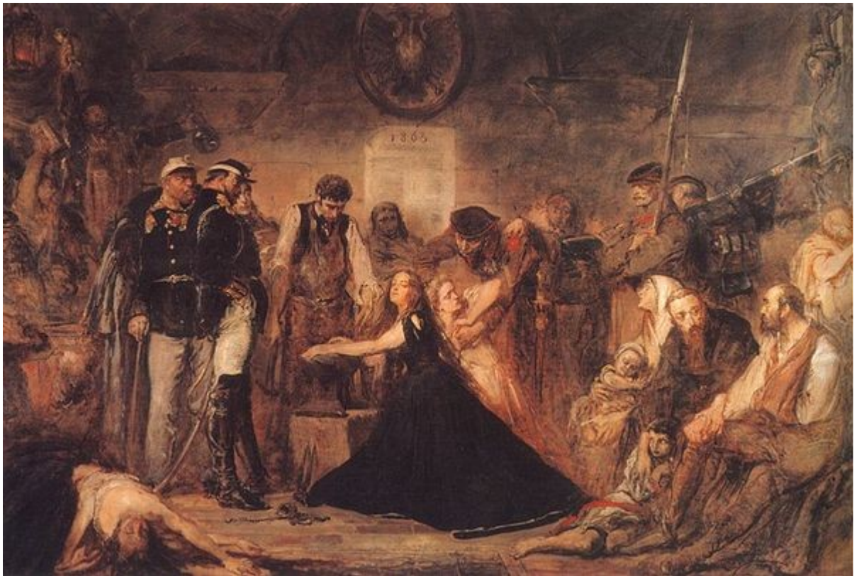
Jan Matejko, Rok 1863 – Polonia. 1864. Olej na płótnie, 156 x 232 cm

(1869), Stefan Batory pod Pskowem (1872), Zawieszenie dzwonu Zygmunta (1874), Bitwa pod Grunwaldem (1878), Hołd pruski (1882), Sobieski pod Wiedniem (1883), Kościuszko pod Raławicami (1888), Konstytucja 3 Maja (1891) oraz cykl Dzieje cywilizacji w Polsce (1889). Większość z nich to ogromnych rozmiarów kompozycje o wielkiej sile wyrazu, które cechuje połączenie realistycznej obserwacji i dokumentalnej ścisłości szczegółów z dynamicznymi układami kompozycyjnymi całości obrazu. Dzieła Matejki, przesycone głębokim patriotyzmem, ukazywały społeczeństwu polskiemu wizję przeszłości i odegrały dużą rolę w umacnianiu świadomości narodowej.