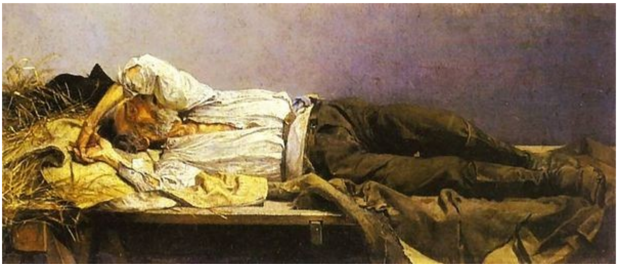
Jacek Malczewski, Sybirak. 1887. Olej na tekturze. 16,5 x 39 cm