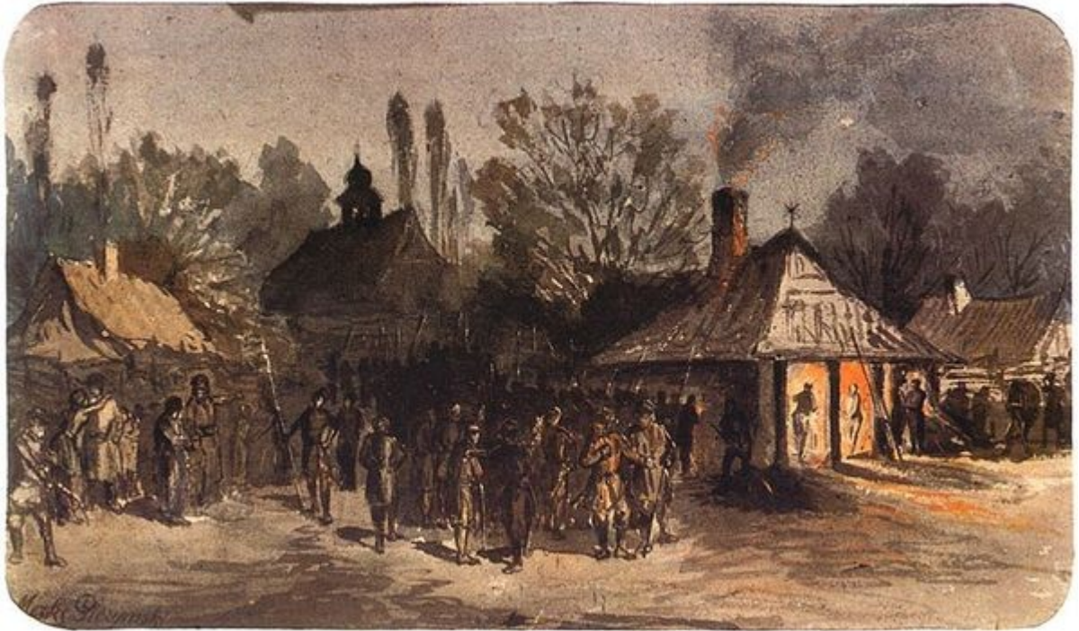
Maksymilian Gierymski, Wymarsz powstańców ze wsi w 1863 roku. Ok. 1867. Akwarela, tektura. 17,3 x 28,7 cm