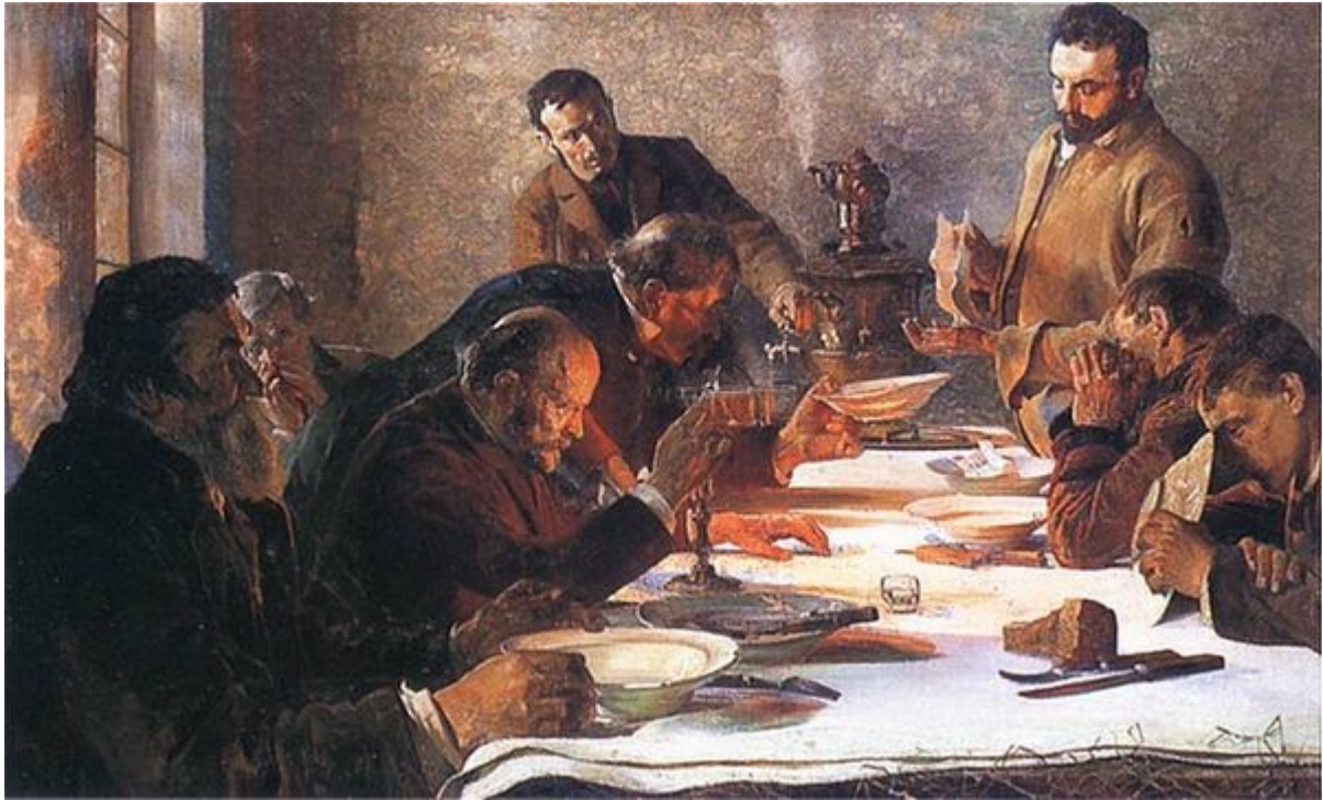
Jacek Malczewski, Wigilia na Syberii 1892. Olej na płótnie. 81 x 126 cm