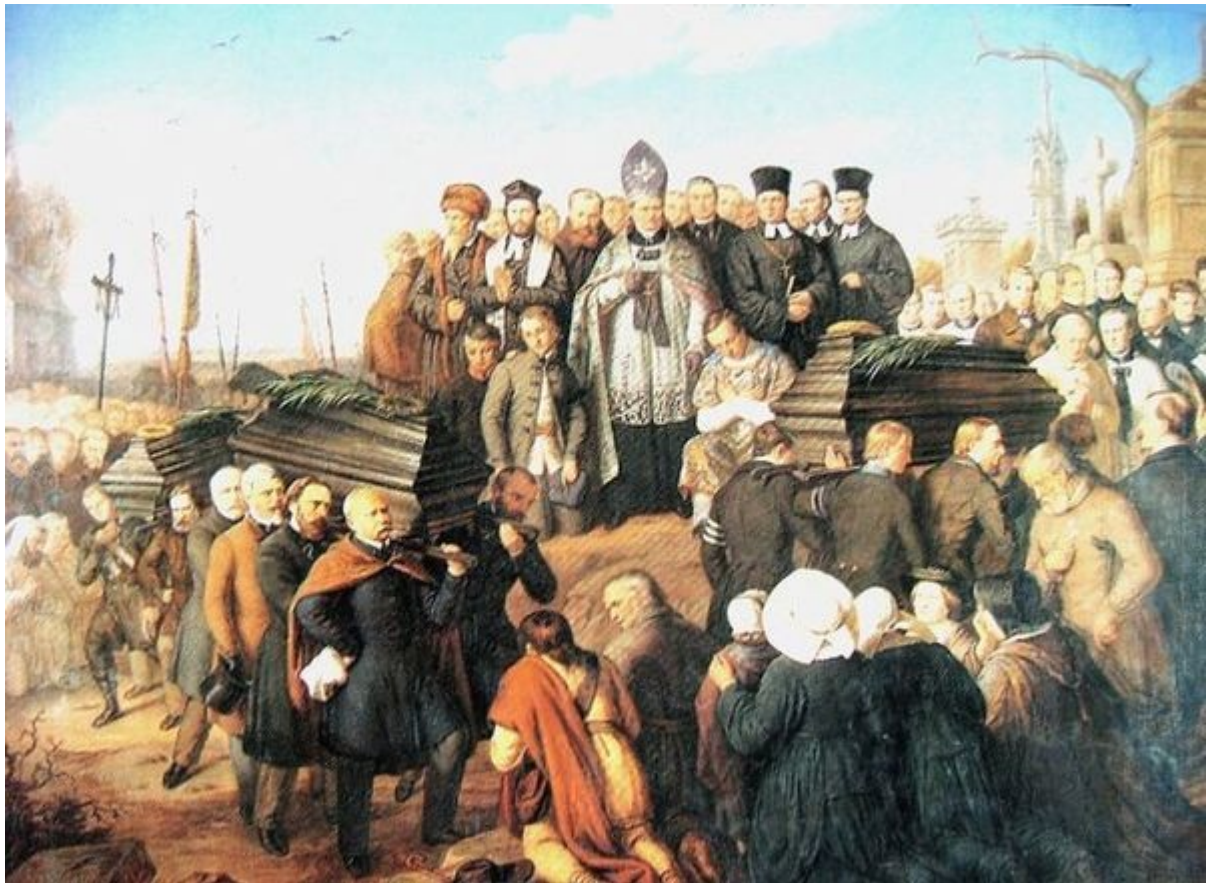
Aleksander Lesser Pogrzeb Pięciu Poległych na Starych Powązkach w Warszawie, 1861.

Oba przedstawione wyżej obrazy odnoszą się do pogrzebu ofiar manifestacji patriotycznej w Warszawie z 27 lutego 1861r. gdy na Krakowskim Przedmieściu od salwy rosyjskiej padło pięciu manifestantów. Sam pogrzeb miał miejsce w dniu 2 marca 1861r. Uroczyste nabożeństwo żałobne odbyło się w kościele św. Krzyża, następnie pochód niosący trumny na rękach przeszedł przez plac Saski w kierunku Starych Powązek. Zabici w manifestacji byli różnego wyznania, stąd obecność na pogrzebie duchownych katolickich, protestanckich oraz żydowskich, co jest widoczne na obu dziełach.