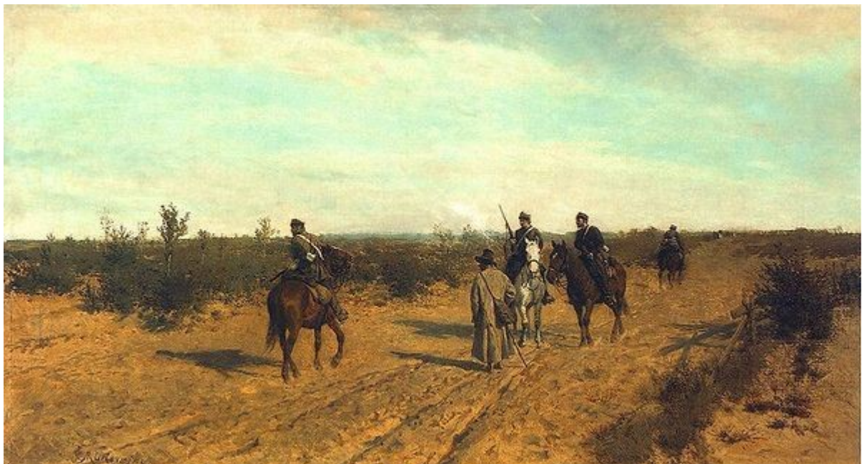
Maksymilian Gierymski, Patrol powstańczy – pikietą.