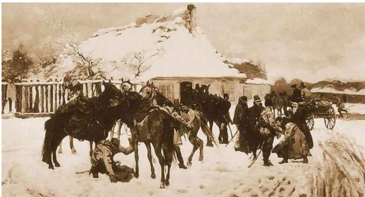
Józef Chelmoński, Powstańcy przed karczmą. 1885. Olej na płótnie. 64 x 125 cm