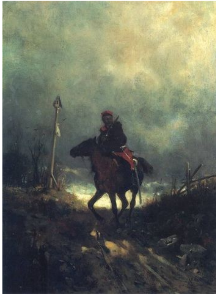
Maksymilian Gierymski, Powstaniec z 1863 roku. Ok. 1869. Olej na desce. 31 x 24 cm