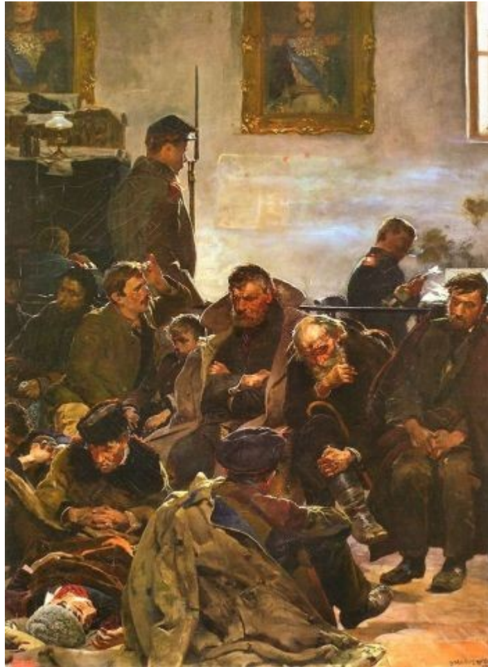
Jacek Malczewski, Na etapie (Sybiracy) 1890. Olej na płótnie. 65 x 48 cm