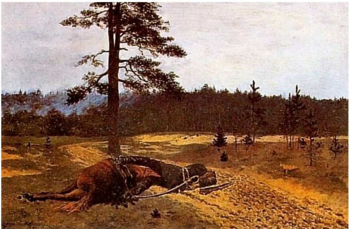
Stanisław Witkiewicz, Powstaniec zabity 1882. Olej. 42 x 63 cm